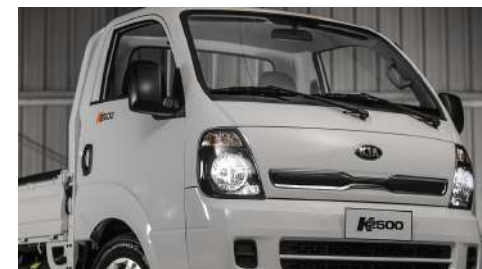
Encendido automático de luces.