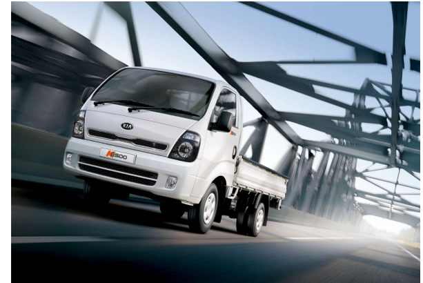
El K2500 posee ABS (Sistema Antibloqueo de Frenos)

Amplia y cómoda cabina renovada. Equipada con equipo de audio Radio/USB/AUX, bandeja central con apoya vasos y asientos de simil cuero.