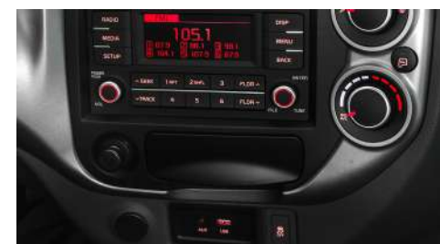
Consola central renovada con conexión AUX y USB.