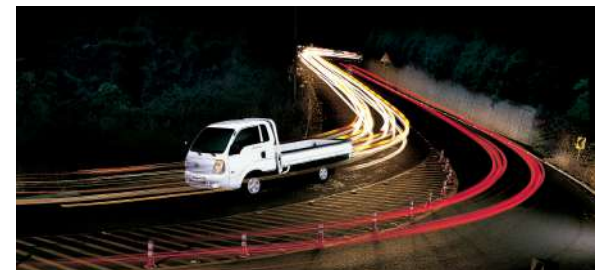
ESC (Control electrónico de estabilidad) junto con freno a disco delantero.