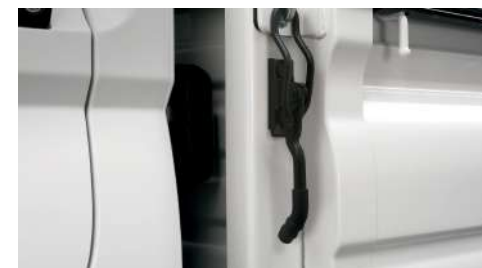
Manija ergonómica de cierre rápido. El resorte interno asegura un movimiento suave de sujeción de las puertas laterales rebatibles.